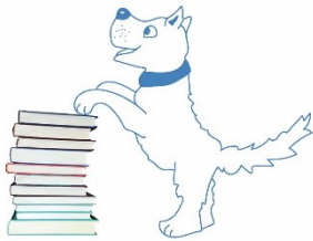
HELFENDE TIERE Leselernhund-Team