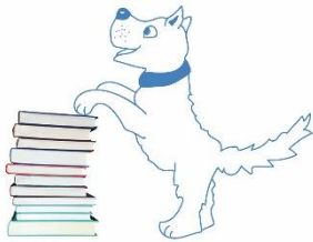
HELFENDE TIERE Leselernhund-Team