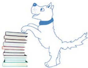
HELFENDE TIERE Leselernhunde-Team