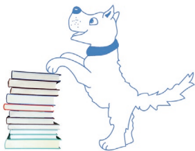
HELFENDE TIERE Leselernhunde-Team